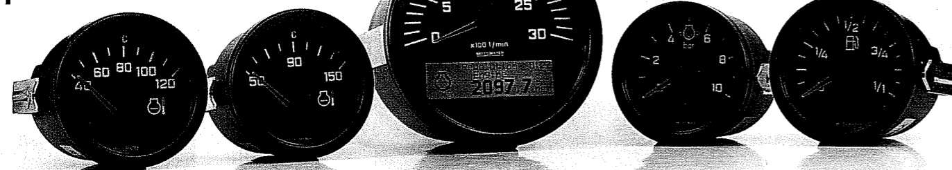
Das Zentralinstrument des CAN 80 ist ein Rundinstrument mit einem Einbaudurchmesser von 80 mm.

Die Vereinfachung der Bedienung von Fahrzeugen hat sich Motometer zum Ziel gesetzt. 1912 entwickelte ein schwäbischer Erfinder praktische Hilfsmittel und Geräte für die Autowerkstatt und für die Fahrzeugausrüstung. Beim ersten Produkt handelte es sich um eine Temperaturanzeige, welche direkt auf den Kühlwasserkühler aufgeschraubt wurde.